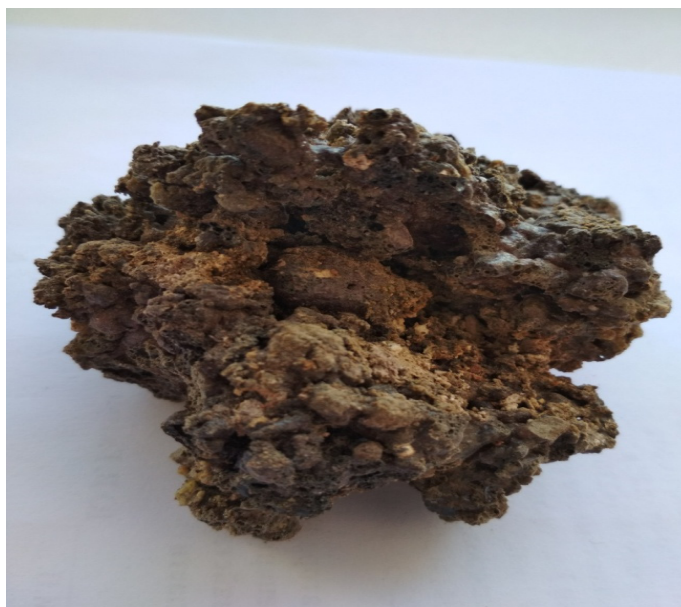
Рис. 2. Шлак после автономного замкнутого деструктора низкого давления Fig. 2. Sludge after an autonomous closed low pressure destructor

Вид шлака после автономного замкнутого деструктора низкого давления представлен на рис. 2.