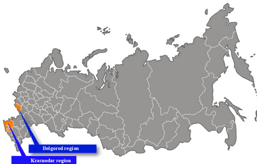
Рис. 1. Регионы России, где проводились исследования [Novykh et al, 2022] Fig. 1. Regions of Russia where studies were conducted [Novykh et al, 2022]

Объектами изучения послужили некоторые почвы двух регионов России (Краснодарского края и Белгородской области), местоположение которых на территории России показано на рис. 1. Общими особенностями регионов является повышенная антропогенная нагрузка, связанная с сельскохозяйственным производством: земли сельскохозяйственного назначения занимают в Белгородской области более 70 % территории, а в Краснодарском крае – около 62 %.