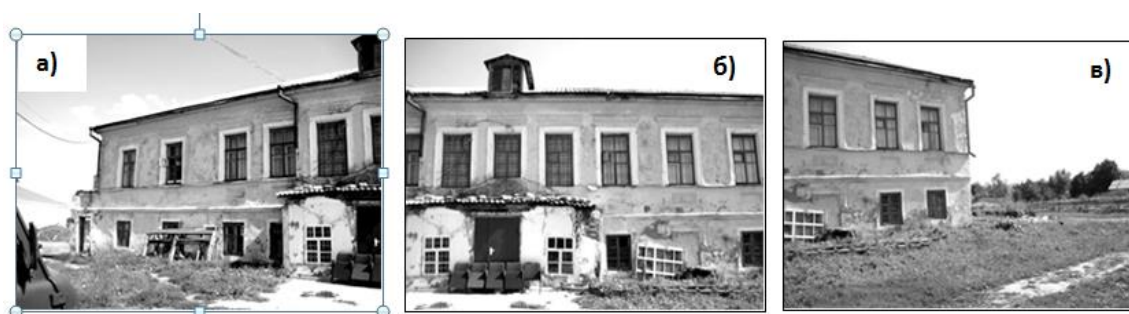
Рис. 2. Современное состояние здания «Усадьба графини А.В. Ластовской»:

К середине 1990-х годов здание усадьбы графини Ластовской по результатам технического обследования было признано аварийным, около 30 лет его эксплуатация запрещена. В настоящее время этот памятник градостроительства и архитектуры пустует. На представленных ниже рисунках показано современное состояние здания (рис. 2).