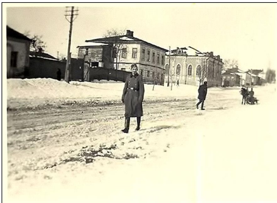
Рис. 7. Дом Шашурина на немецком фото времен оккупации (зима 1942 года). Снимок сделан с чётной стороны улицы Князя Трубецкого, в настоящее время на месте, откуда был сделан снимок, находится многоэтажный жилой дом № 52 Fig. 7. "Shashurin's House" in a German photo from the time of the occupation (winter 1942). The picture was taken from the even side of Knyaz Trubetskoy Street, at the present time, at the place where the picture was taken, there is a multi-storey residential building № 52

На рис. 7 с южной стороны здания видна дощатая пристройка – вход в помещения второго этажа. Пристройка была выполнена при разделении дома на отдельные квартиры.