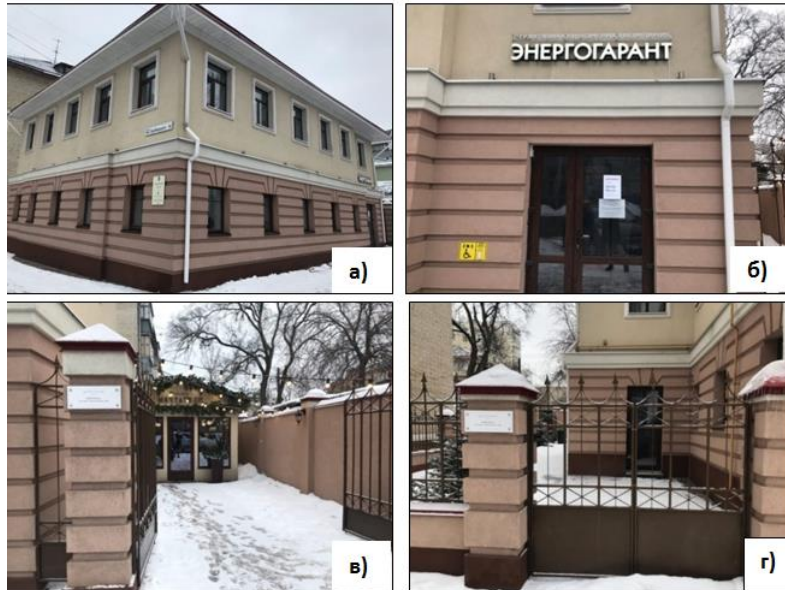
Рис. 8. Памятник архитектуры «Дом Шашурина» (г. Белгород, улица Князя Трубецкого, 41), 2022 г. а) Общий вид здания. б) Вход в Страховую акционерную компанию «Энергогарант», расположенную на первом и втором этажах. в) Вход в кафе «Мечтатели», расположенное в пристройке на первом этаже. г) Въезд во двор здания Fig.8. Monument of architecture "Shashurin's House" (Belgorod, Knyaz Trubetskoy street, 41), 2022 a) General view of the building. b) Entrance to the Energogorant Insurance Joint Stock Company located on the first and second floors. c) Entrance to the cafe "Dreamers", located in the annex on the ground floor. d) entrance to the courtyard of the building