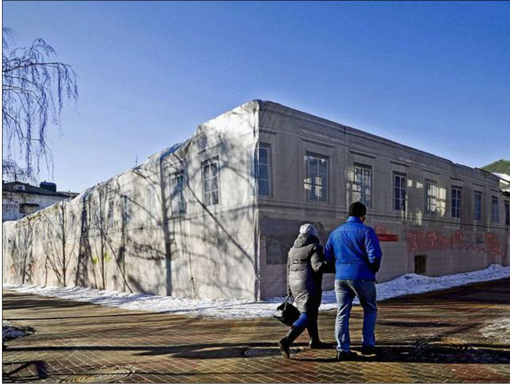
Рис. 12. Общий вид Жилого дома Мачурина по состоянию на 2022 год Fig. 12. General view of the Machurin Residential Building as of 2022

Региональное управление государственной охраны объектов культурного наследия пыталось добиться того, чтобы собственник здания выполнил капитальный ремонт конструкций. Собственник здания успел реализовать снятие крыши здания, вследствие чего снег, дождь и талые воды попали внутрь важных конструкций здания (рис. 12).