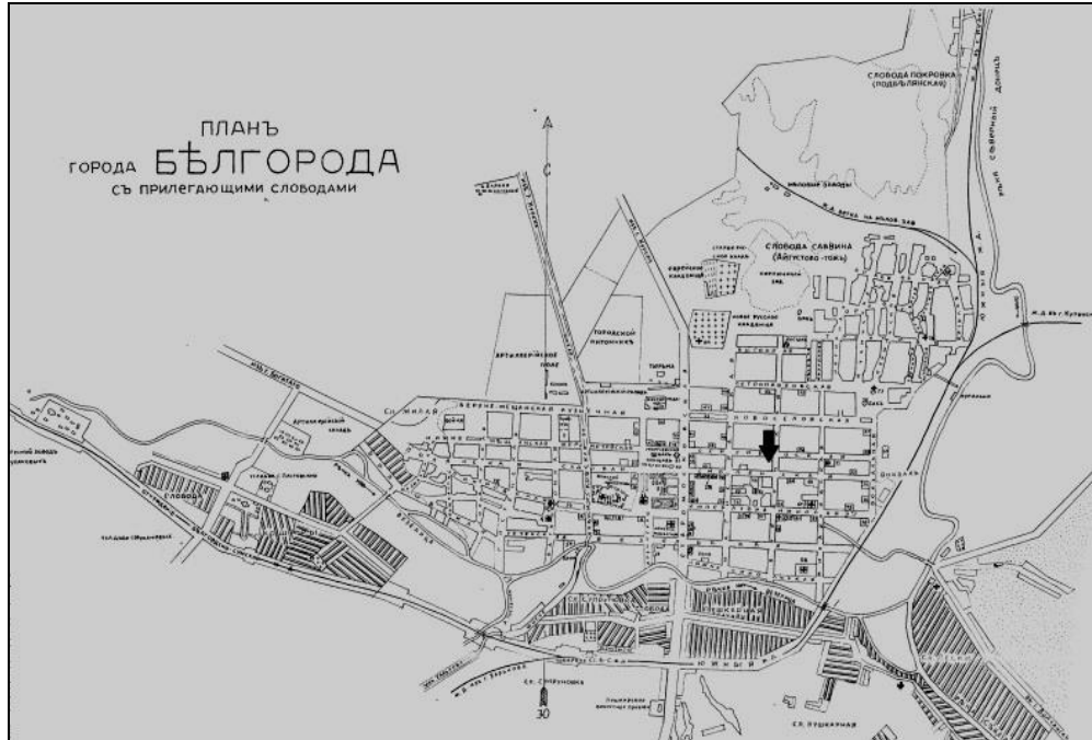
Рис. 5. План Белгорода 1911 года. На пересечении улиц Сергиевской и Введенской (нынешних Преображенской и кн. Трубецкого) чёрной стрелкой показано расположение здания «Дом Шашурина»

1768 году архитектором А.В. Квасовым. Следует отметить, что такая планировочная структура центральной части города с прилегающими слободами соблюдалась до начала XX века (рис. 5). В наши дни современное расположение центральных улиц Белгорода также соответствует этому плану.