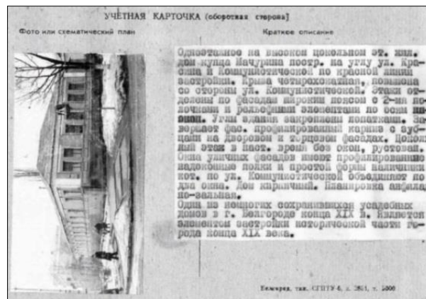
Рис. 9. Учётная карточка жилого дома купца Мачурина Fig. 9. Registration card of the residential house of the merchant Machurin

Жилой дом, ныне известный как Жилой дом Мачурина по улице Преображенская, 57, был построен в конце XIX века (рис. 9).