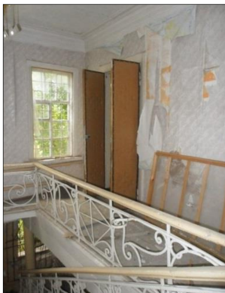
Рис. 3. Часть интерьера здания усадьбы графини Ластовской (современное состояние) Fig. 3. Part of the interior of the building of the estate of Countess Lastovskaya (current state)

Как показало обследование, первый этаж выполнен из кирпича, уложенного толщиной 2\frac{1}{2} кирпича, который не отличается для наружных и внутренних стен. Стены фактически являются продолжением кирпичных ленточных фундаментов, глубина заложения которых по всему периметру здания не превышает 500 мм. Цокольная часть наружных стен конструктивно не выделена. Стены второго этажа деревянные, внутренние стены оштукатурены по дранке, наружные стены облицованы кирпичом. Перекрытие первого этажа и чердачное перекрытие – деревянные по деревянным балкам. Внутренняя лестница выполнена из дерева с кованым металлическим ограждением. Крыша чердачная, вальмовая с деревянной стропильной системой. Кровля выполнена из волнистых асбестоцементных листов, что указывает на проведённый капитальный ремонт кровли в советский период эксплуатации здания. Асбестоцементные листы уложены по дощатой обрешётке с прозорами. Под частью здания имеется погреб с кирпичными стенами и кирпичными сводчатыми перекрытиями.