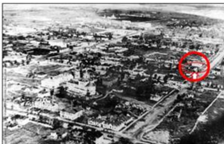
Рис. 6. Аэрофотоснимок центральной части г. Белгорода (до 1941 года).

В начале XX века здание «Дом Шашурина» использовалось как муниципальное коммунальное жилье. Его расположение на городской панораме в довоенные годы и вид здания в годы оккупации Белгорода немецко-фашистскими захватчиками показаны на рис. 6 и 7.