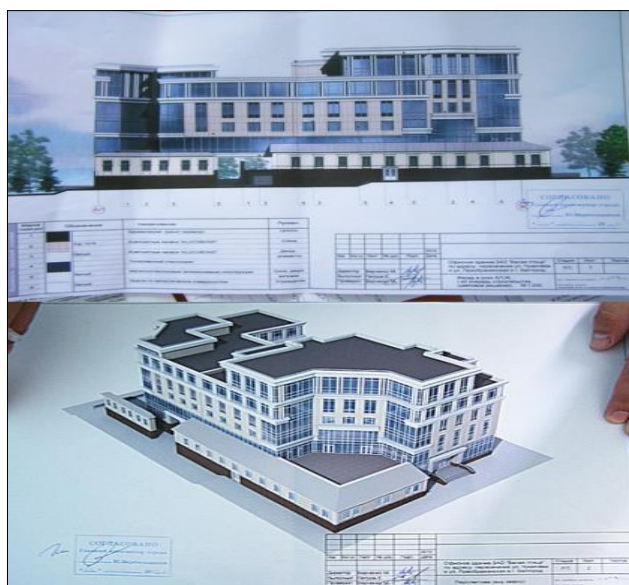
Рис. 11. Утверждённый в 2012 году проект реконструкции памятника архитектуры «Жилой дом Мачурина» Fig. 11. Approved in 2012, the project for the reconstruction of the architectural monument "Machurin Residential House"

В 2011 году бывший собственник здания «Жилой дом Мачурина» планировал построить на его месте центральный офис в несколько этажей из стекла и бетона, но по ряду причин работы были приостановлены, и здание несколько лет стояло открытым [Бел-Пресса, 2023]. Фрагмент утверждённого городскими властями проекта реконструкции памятника архитектуры «Жилой дом Мачурина» представлен на рис. 11.