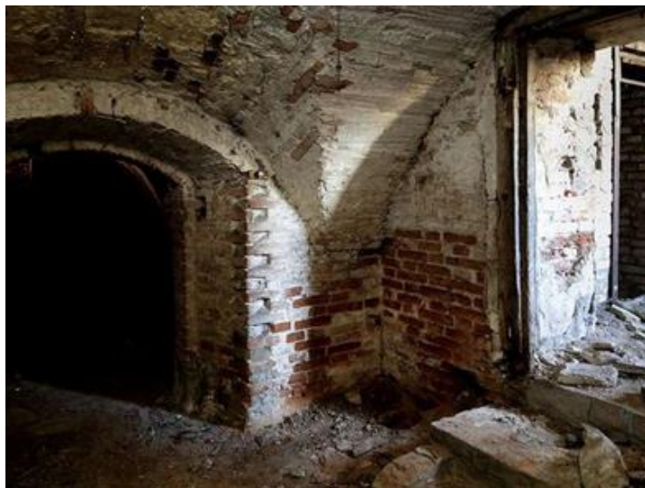
Рис. 10. Часть цокольного этажа здания «Жилой дом Мачурина» Fig. 10. Part of the basement floor of the building "Machurin Residential House"

На рис. 10 показана часть цокольного этажа, входящего в предмет охраны.