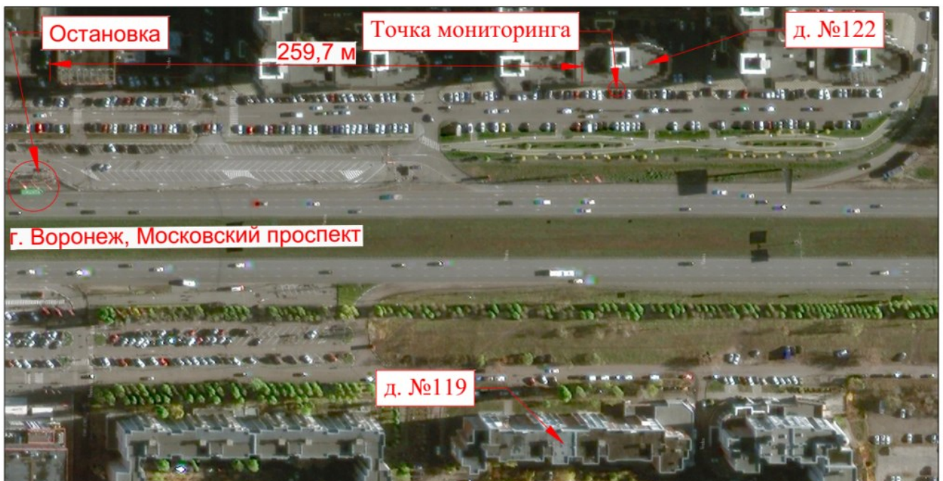
Рис. 1. Схема территории проведения эксперимента: Московский проспект, дома 122 и 119 Fig. 1. Plan of the territory of the experiment: Moskovsky Prospekt, buildings 122 and 119

1 -классификация УДС приведена согласно таблице 11.1 [СП 42.13330.2016, 2016].