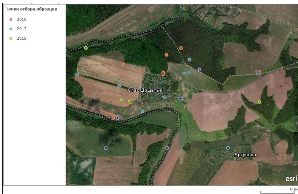
Рис. 1. Картограмма точек отбора образцов

Наиболее высокое загрязнение наблюдается в средней части плакора, что значительно увеличивает риск попадания загрязнителей в грунтовые воды.