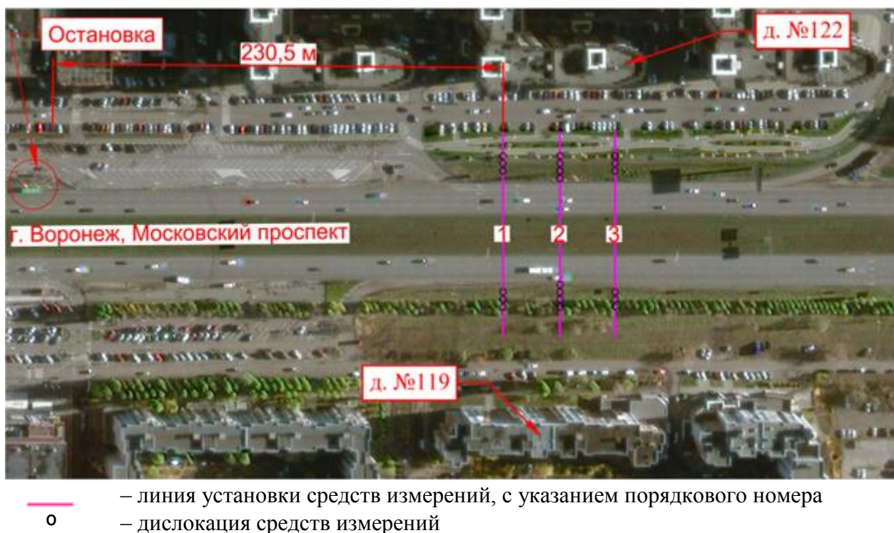
Рис. 1. Схема территории проведения эксперимента Fig. 1. Layout of the area under experiment

Для постановки эксперимента был выбран один из интенсивных участков улично-дорожной сети – Московский проспект (поперечник: дома № 122 и 119). Выбранный участок характеризуется типовой застройкой. Дома первого эшелона представлены конструкциями в 10 и 14 этажей, с удалением от ближайшей оси движения автотранспортных средств соответственно на 52 и 66 м. Согласно своду правил [СП 42.13330.2016] рассматриваемый источник загрязнения относится к магистральным улицам общегородского значения 2-го класса – регулируемого движения. Место для проведения измерений эквивалентного уровня звука, образованного функционированием улично-дорожной сети, соответствовало требованиям межгосударственного стандарта [ГОСТ 20444-2014]. На рис. 1 представлена схема участка проведения эксперимента.